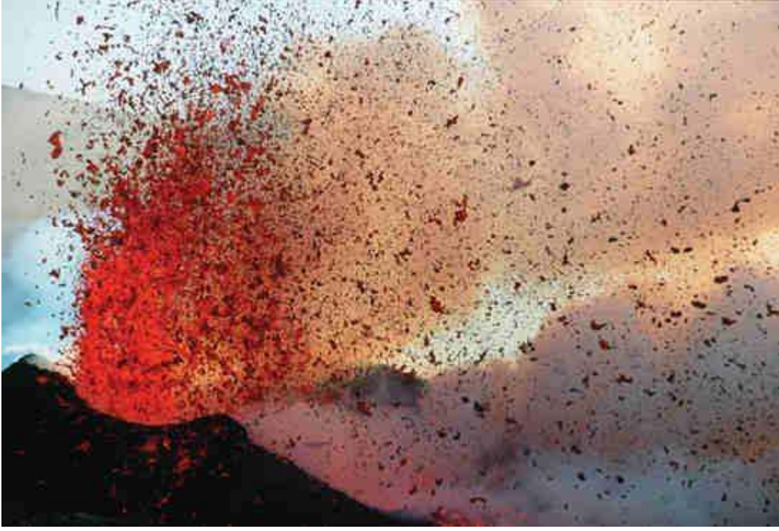
Volkan Patlaması Etna Yanardağı